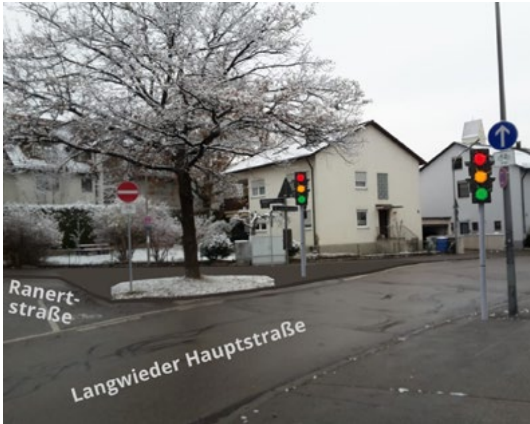
Blick von Süd-West (Lochhausener Straße)