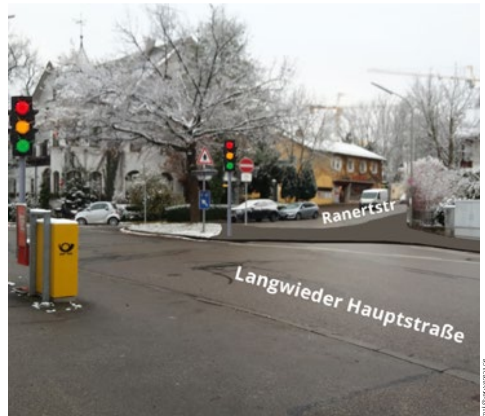
Blick von Nord-Ost (Eschenrieder Straße)